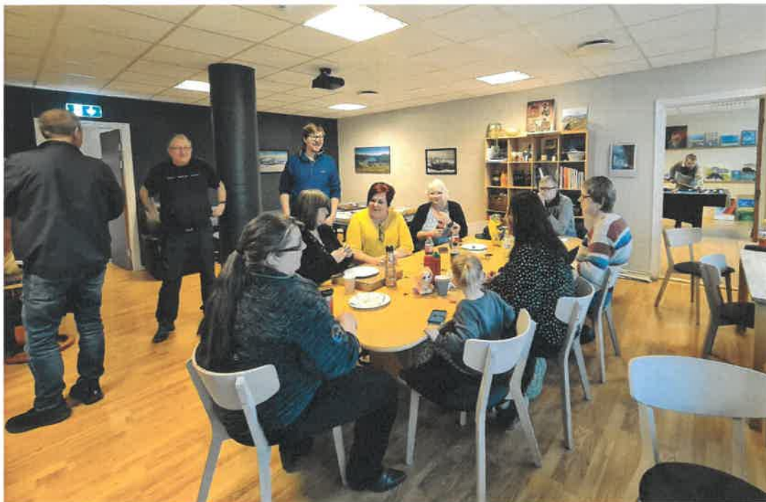
Velferdstiltak i lokallagene.

Medlemmene og lokallagene danner grasrota og er grunnlaget for driften i fylkeslaget. Uten dem ville organisasjonen vært lite synlig i samfunnet til daglig. Fylkeslaget Mental Helse Møre og Romsdal støtter opp om samholdet blant medlemmene og lokallagene ved å gi råd og veiledning.