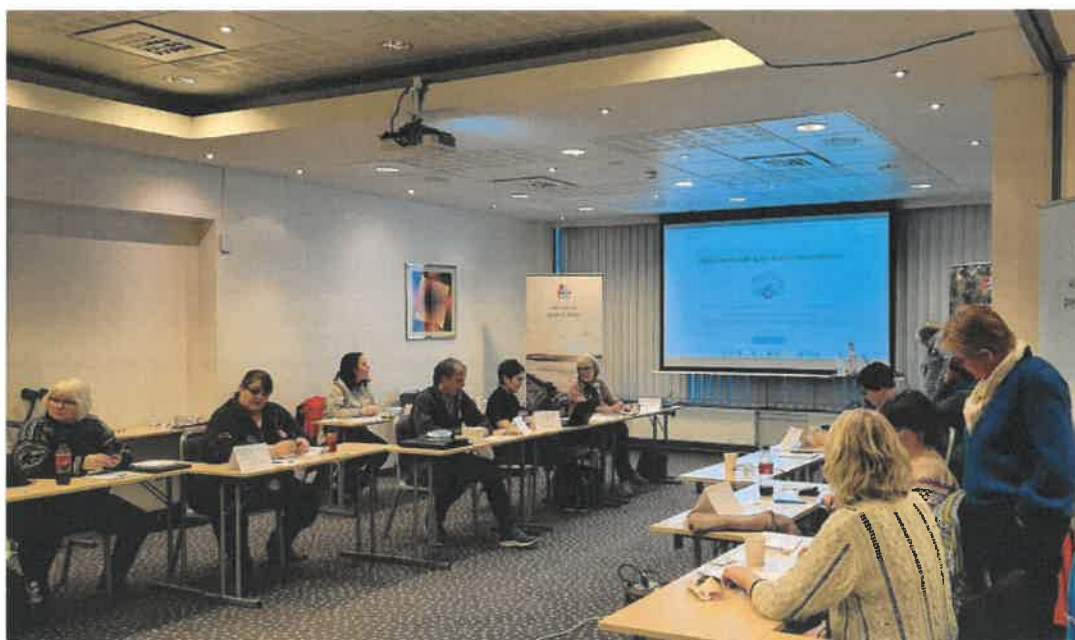
Ledermøte for lokallagene.

På programmet stod nytt fra lokallagene, orientering om Frivillighetens år, og Mental Helse -konferansen Vår dag 10.mars. I tillegg ble det informert om uke 23, da vil vi i Møre og Romsdal markere frivilligheten i hele fylket. Det ble informert om hvordan likepersonsarbeid i lokallagene kan gjennomføres og rapporteres. Det ble også informert om den videre framdriften i prosjektet undervisningsprogrammet YAM. Kort informasjon om samling/kurs for brukerrepresentanter i Mental Helse Møre og Romsdal og andre organisasjoner under FFO Møre og Romsdal.