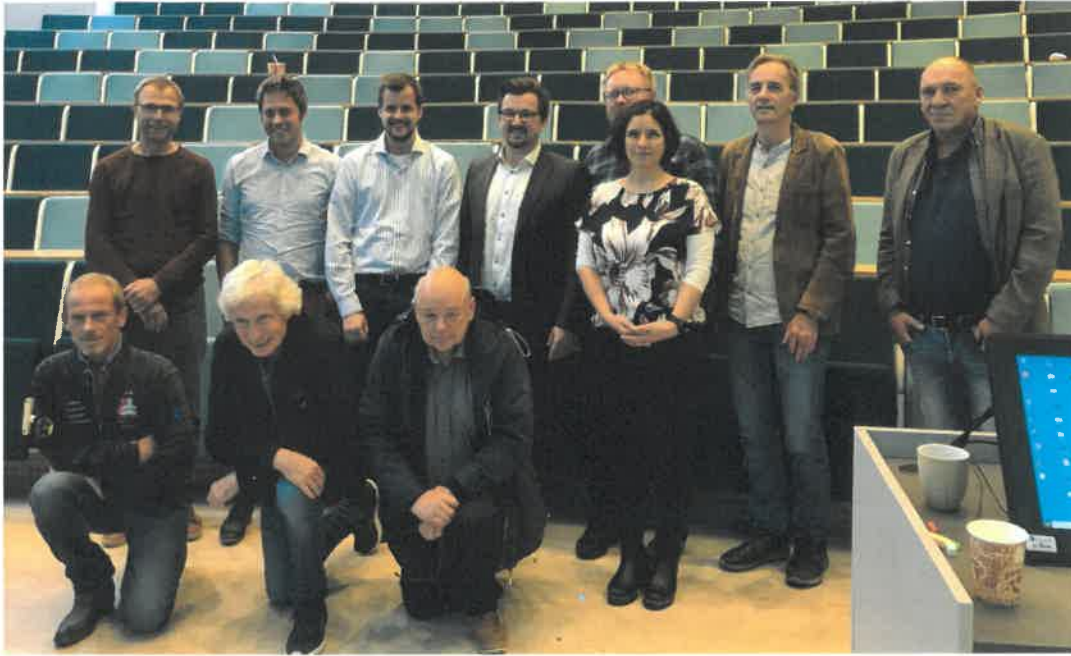
Vi setter brukermedvirkning i forskning på dagsorden under fag- og forskingsdagen ved Høgskolen i Molde.

Mental Helse skal være en synlig og troverdig samfunnsaktør. Fylkesstyret jobber derfor for at hele organisasjonene skal være til stede på arenaer der vi kan påvirke samfunnet for å nå vårt mål.