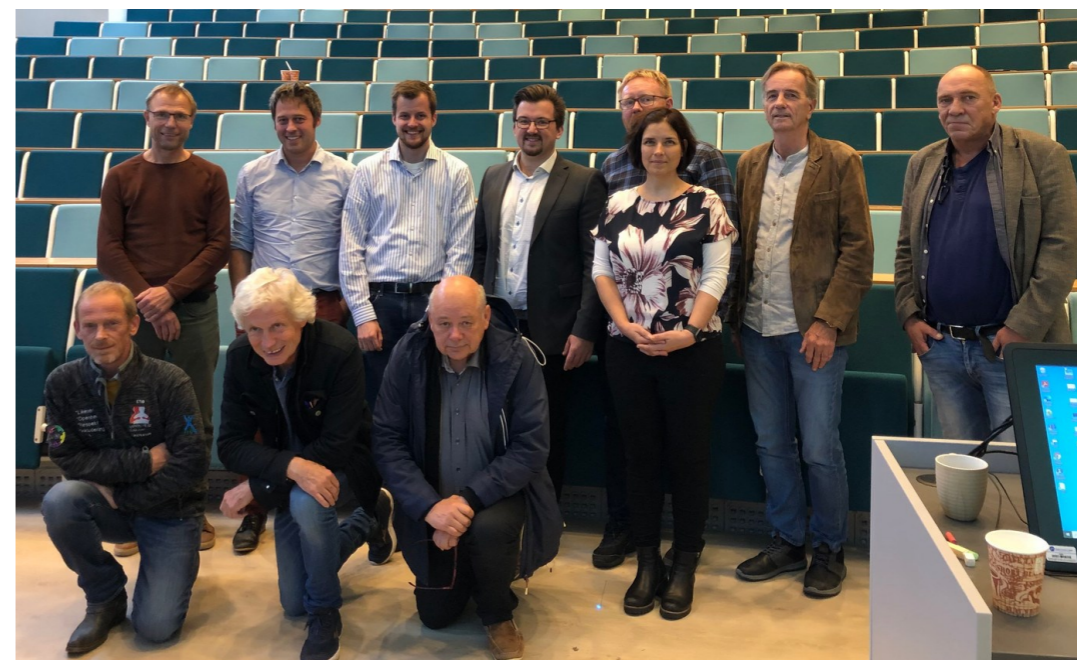
Vi setter brukermidvirkning i forskning på dagsorden under fag- og forskingsdagen ved Høgskolen i Molde.

Mental Helse skal være en synlig og troverdig samfunnsaktør. Fylkesstyret jobber derfor for at hele organisasjonene skal være til stede på arenaer der vi kan påvirke samfunnet for å nå vårt mål.