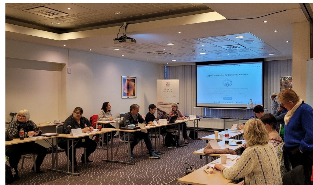
Ledermøte for lokallagene.

På programmet stod nytt fra lokallagene, orientering om Frivillighetens år, og Mental Helse -konferansen Vår dag 10.mars. I tillegg ble det informert om uke 23, da vil vi i Møre og Romsdal markere frivilligheten i hele fylket. Det ble informert om hvordan likepersonsarbeid i lokallagene kan gjennomføres og rapporteres. Det ble også informert om den videre framdriften i prosjektet undervisningsprogrammet YAM. Kort informasjon om samling/kurs for brukerrepresentanter i Mental Helse Møre og Romsdal og andre organisasjoner under FFO Møre og Romsdal.