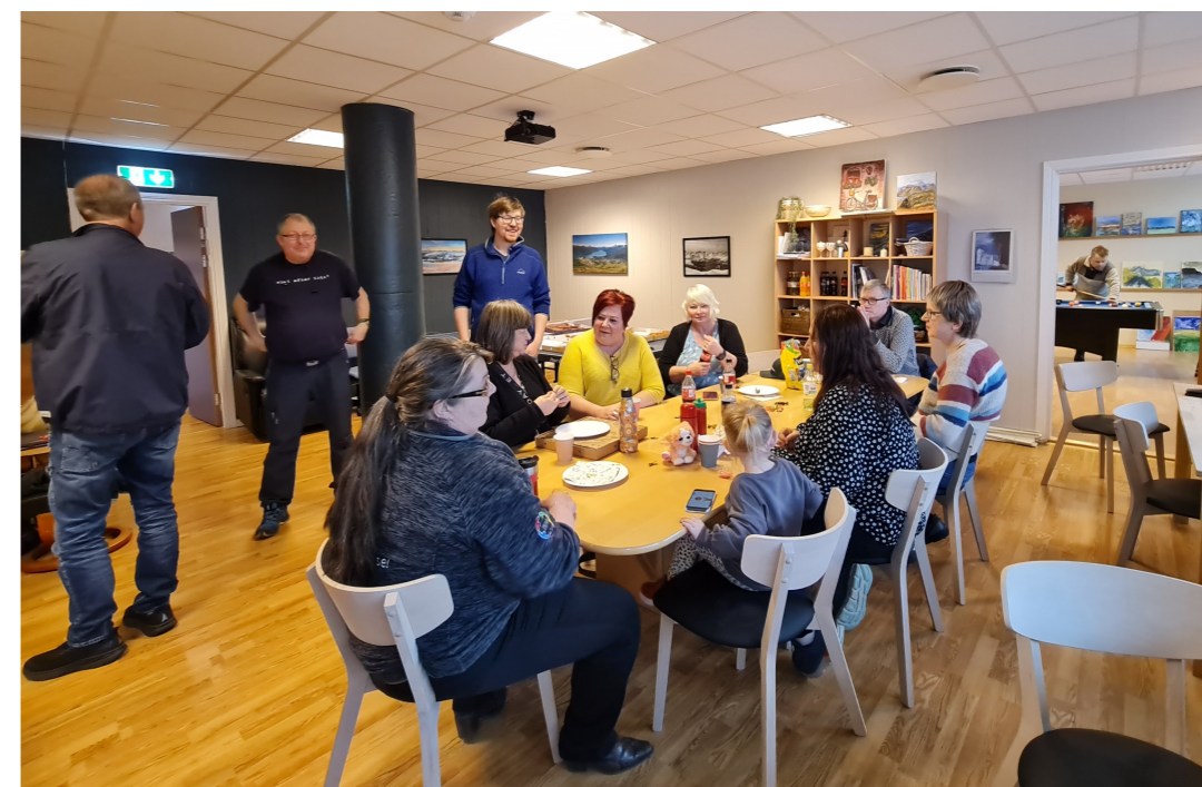
Velferdstiltak i lokallagene.

Medlemmene og lokallagene danner grasrota og er grunnlaget for driften i fylkeslaget. Uten dem ville organisasjonen vært lite synlig i samfunnet til daglig. Fylkeslaget Mental Helse Møre og Romsdal støtter opp om samholdet blant medlemmene og lokallagene ved å gi råd og veiledning.