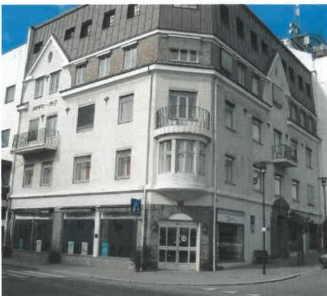
Fylkeslagets brukerstyrte erfarings- og kompetansesenter Strandgata 3 i Molde.

Både medlemmer og samarbeidspartnere finner veien til fylkeslagets kontor for informasjon og dialog.