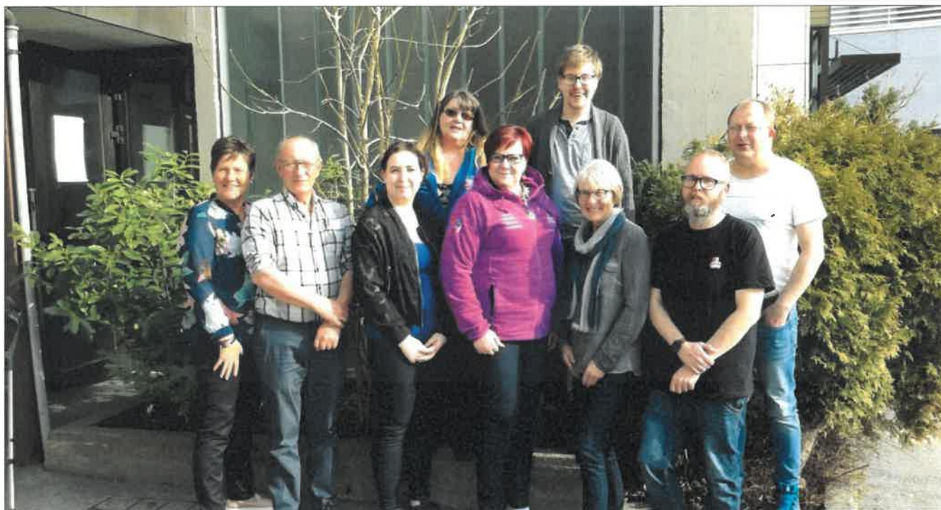
Fylkesstyret med varamedlemmer og ungdomsrepresentanter årsmøteperioden 2018-2019.

Årsmøtet i 2018 ble avholdt på Hotell Alexandra i Molde 15. april. Fylkesstyret sitt mandat for årsmøteperioden 2018-2019 ble gitt av årsmøtet gjennom vedtak i sak om handlingsplan og budsjett. Det valgte fylkesstyret avgir sin årsberetning (årsmelding) for perioden fra 16.04.2018 til 05.05.2019. Årsberetningen viser styrets aktiviteter og driften av fylkeslaget Mental Helse Møre og Romsdal.