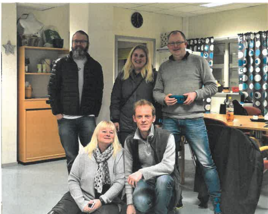
Prosjektarbeid aktiviserer medlemmene. Prosjektgruppen for kompetansekartlegging 2016-2018.