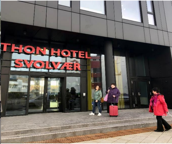
Ankommet Thon hotellet