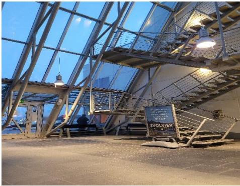
Ventehallen i Svolvær