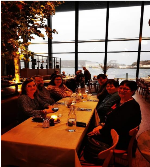
Styret samlet på Hotell Ramsalt i Bodø