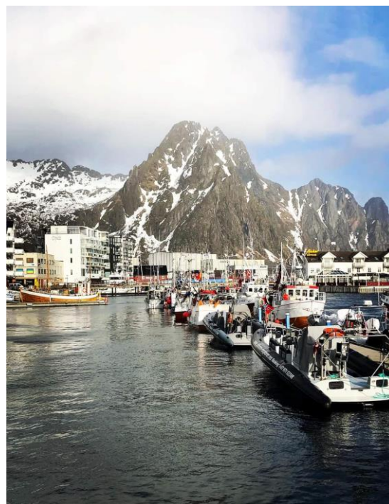
Fra havna i Svolvær, og Svolværgeita i bakgrunnen