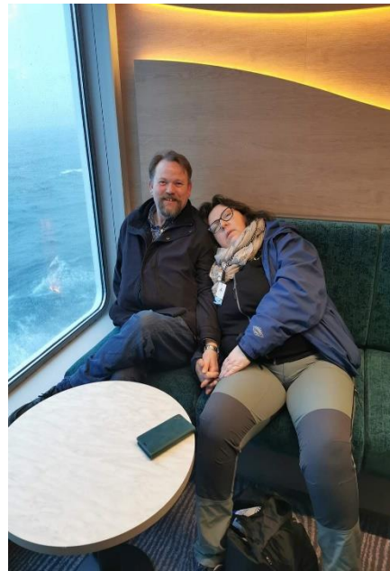
Ei som ble en smule sjøsyk ;)