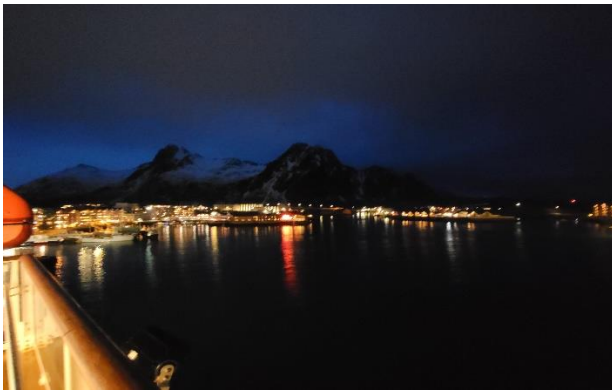
Kveld i Svolvær, tatt fra båten