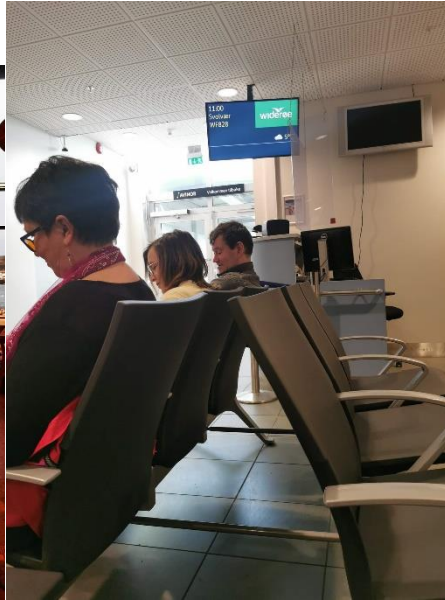
Venting på Widerøe ved utgang 13, Bodø flyplass.