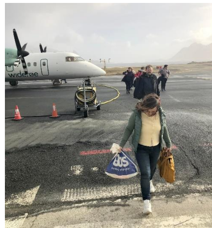
Trygt landet på Svolvær flyplass, og vi sto han av..