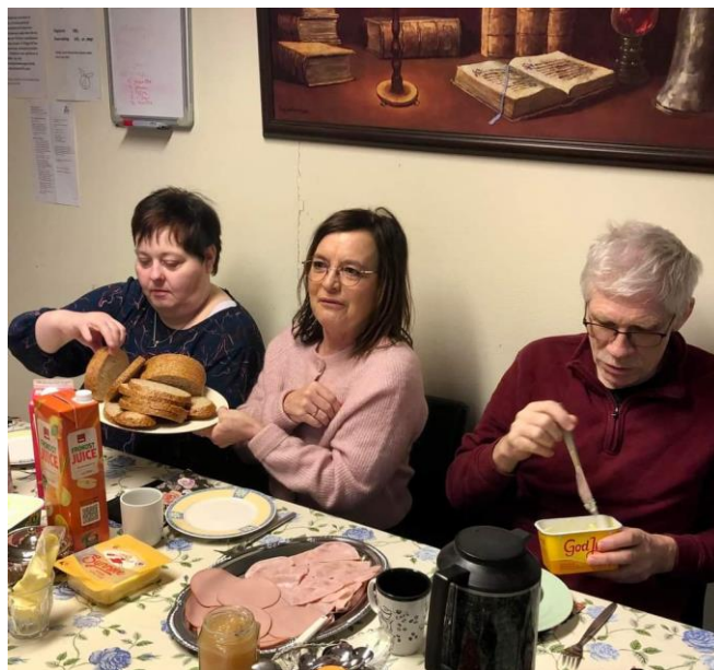
Frokost etter ankomst Ørnes med medlemmer fra Søndre Salten.