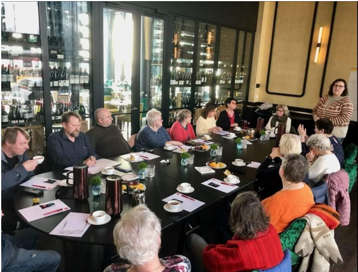
Fint møte med MH Vågan og MH Vestvågøy, ei fin og informativ stund..