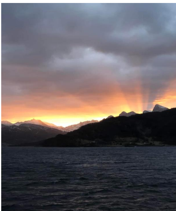
Fantastisk bilde tatt på turen med MS Vesterålen