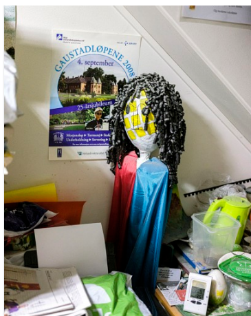
LAGER: 25 år og 37 oppsetninger til tross – det meste av Teater Vildenveis kostymelager er både bevart og i god stand.