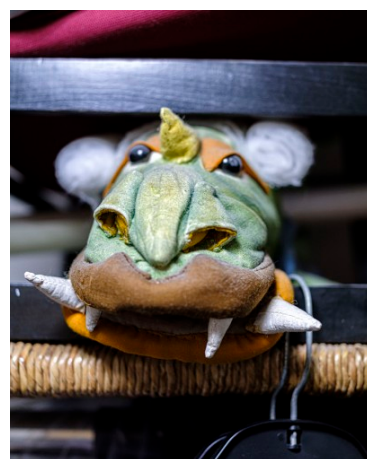
TRYGGE RAMMER: Sidsel Grue har laget mange av kostymene til Teater Vildenvei. Hun forteller at noe av poenget med teateret er å være en gruppe med trygge rammer.